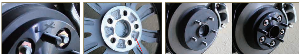
表面に「LX」の刻印入り