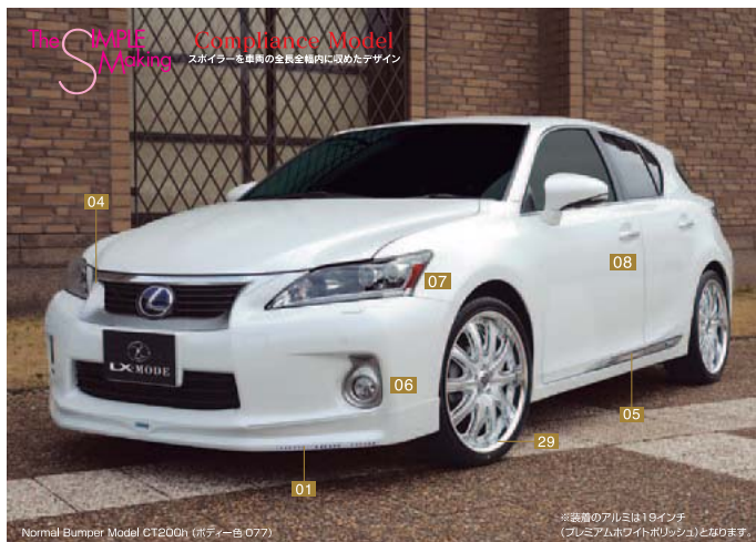
Normal Bumper Model CT200h (ボディ色:077)